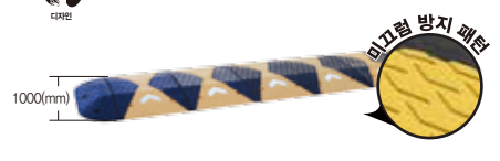
L1000 x H75 x 도로폭(mm)