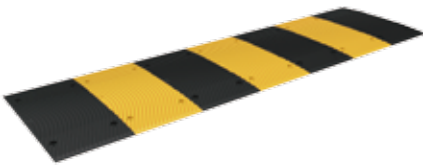
L1000 x H30 x 도로폭(mm)