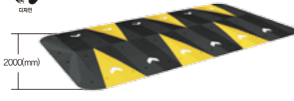
L2000 x H75 x 도로폭(mm)