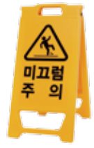
PE 입간판 미니입간판_M W520 x H970(mm) W305 x H650(mm)