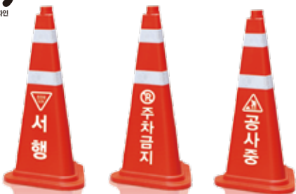
[340x340] x H680(mm)