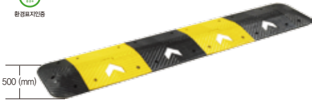
L500 x H50 x 도로폭(mm)