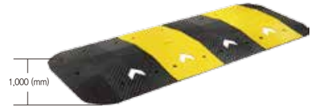
L1000 x H75 x 도로폭(mm)