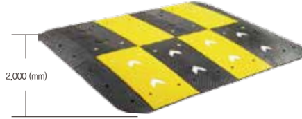
L2000 x H75 x 도로폭(mm)