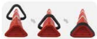
중량보강품 : 약 2kg