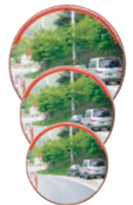
스텐레스 반사경 PC 반사경 Ø1000 / Ø800 / Ø600 Ø1000 / Ø800 / Ø600