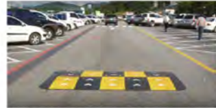
2M 조립식 과속 방지턱 설치 이미지