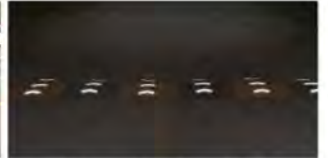
야간 시인성이 우수한 조립식 과속 방지턱