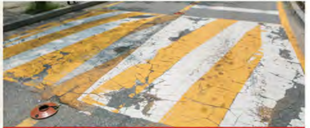
일반 아스콘 과속방지턱