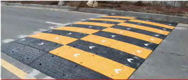
신도산업 3.6M 고무과속방지턱