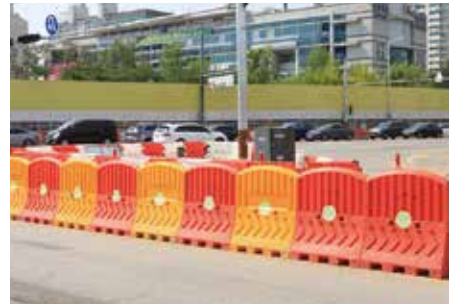
설치장소 : 오산시청 앞