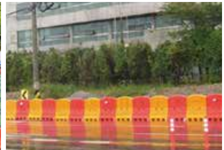
설치장소 : 용인시청 근처