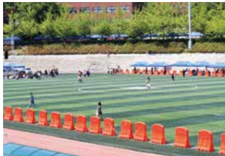
설치장소 : 단국대학교 천안캠퍼스