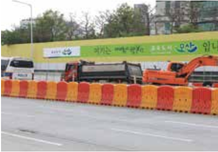
설치장소 : 오산웨딩의전당 인근