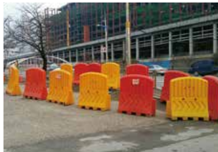
설치장소 : 파주 LG디스플레이 공장인근