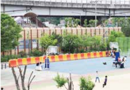
설치장소 : 서울 송덕초등학교