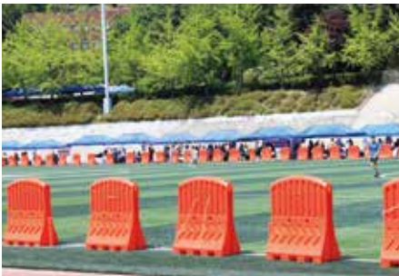
설치장소 : 단국대학교 천안캠퍼스