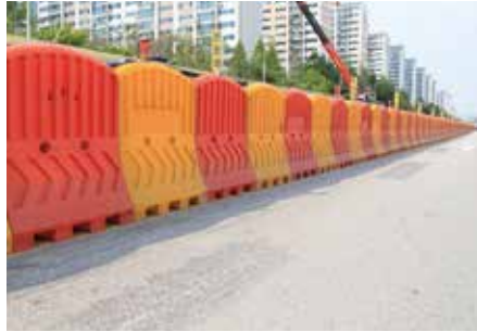
설치장소 : 오산웨딩의전당 인근