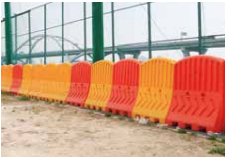
설치장소 : 암사 한강시민공원(구리아구장)