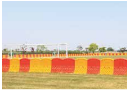
설치장소 : 예산군 무한천체육공원