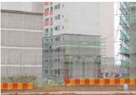
설치장소 : 대구 달성군 공사현장