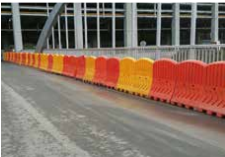
설치장소 : 파주 LG디스플레이 공장인근