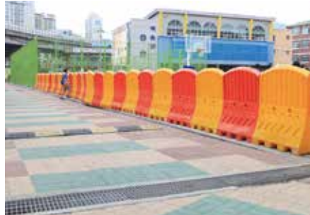
설치장소 : 서울 송덕초등학교