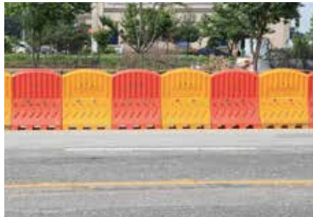
설치장소 : 오산시청 앞