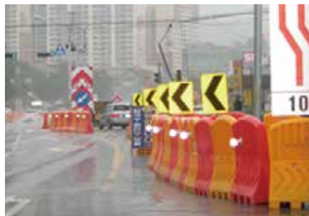
설치장소 : 부산 사하구 공사현장