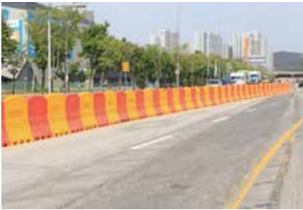
설치장소 : 오산시청 앞