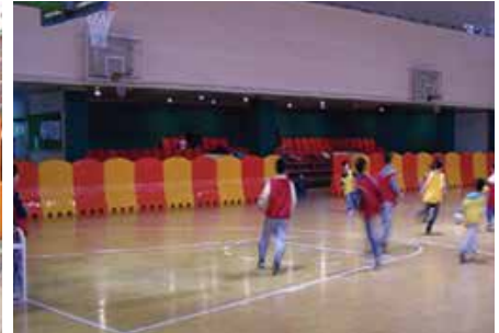
설치장소 : 안양 덕천초등학교