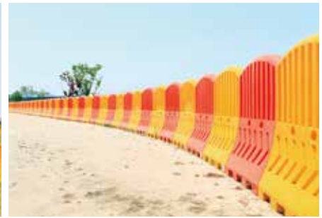
설치장소 : 예산군 무한천체육공원