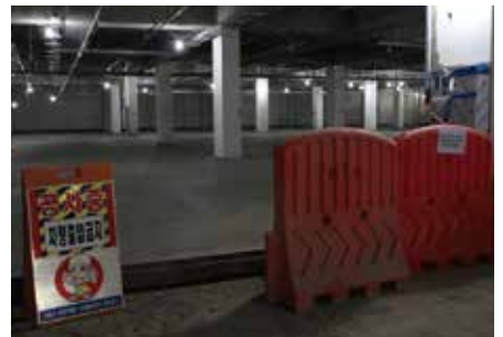
설치장소 : 서울시 어린이병원 신축현장