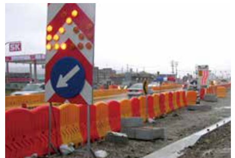
설치장소 : 경남 김해시 공사현장