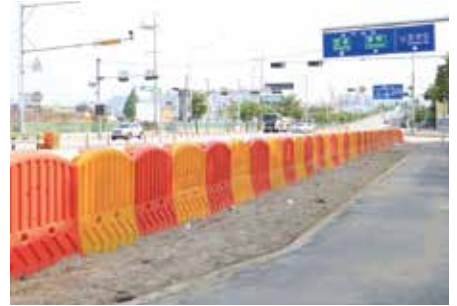
설치장소 : 오산웨딩의전당 인근